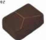
Noix de Pécan Praliné noix de Pécan Pecan nuts praline