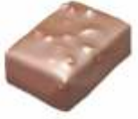
Rocher Gianduja noisettes hachées Minced hazelnut gianduja