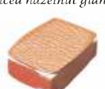
Feuilletine Praliné aux crêpes dentelles Gianduja with crispy lace crepe