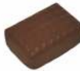
4 épices Anis, gingembre, clou de girofle et cannelle Anise, ginger, clove and cinnamon