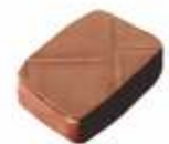
Le Pavé de Claye Praliné amandes, pâte de noisette pure, feuilletine, grué de cacao Almond praline, dough of pure hazelnut, feuilletine and cacao nibs