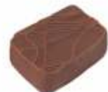
Basilic Ganache Basilic Frais Basilic Ganach