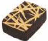
Passion Ganache fruits de la passion Passion ganach