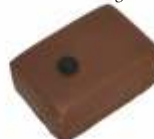
Baie de Timur Ganache Baie de Timur Timur Bay ganach