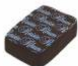
Rhum-Raisin Raisins macérés au rhum Rum raisin