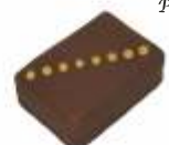
Noix de Cajou Praliné Noix de cajou Cachu nut praline