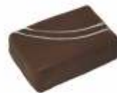
Fève de tonka Ganache Fève de Tonka Tonka bean ganach