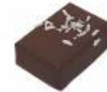
Coco Gianduja noix de coco Coconut gianduja