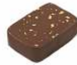
Le Palet Or Ganache Nature à 70% Natural ganach