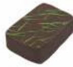
Menthe Ganache Menthe fraîche Fresh mint ganach