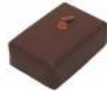
Caramel au beurre salé Ganache lacté, caramel au beurre salé Milk ganach and salted butter caramel