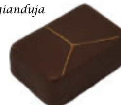
Noix de Pécan

Praliné noix de Pécan Pecan nuts praline