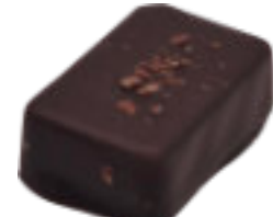
Caramel au beurre salé

Ganache au caramel beurre salé Salted caramel ganache