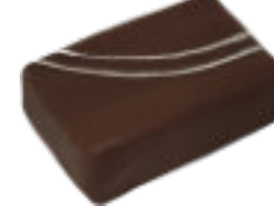
Fève de Tonka

Ganache à la fève de Tonka Tonka bean ganache