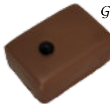
Baie de Timor

Ganache menthe fraîche Fresh mint ganache