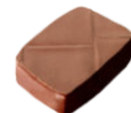
Le Pavé de Claye

Praliné amandes, pâte de noisettes pure, feuilletine, gruée de cacao Almond praline, dough of pure hazelnut, feuilletine and cacao nibs.