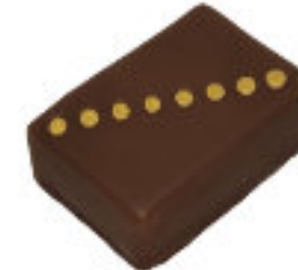
Noix de Cajou

Praliné noix de cajou Cashew nur praline