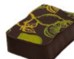
Caramel Citron Basilic

Ganache à la purée de Framboise Raspberry puree